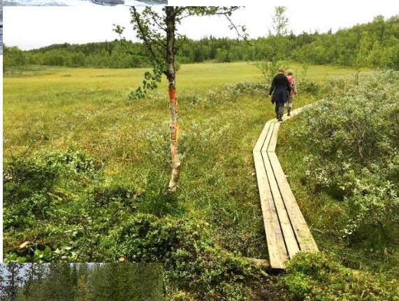
Stigen 7 forsar